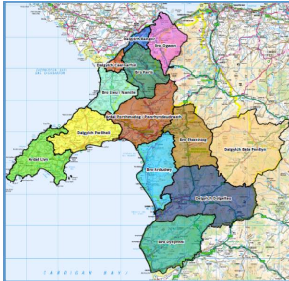
Ardaloedd y Fframwaith Adfywio 1

3.6 Byddai datblygu cyfres o gynlluniau adfywio lleol yn fodd o amlygu nodweddion a blaenoriaethau lleol, a chynnig cyfle i gyd-weithio gyda sefydliadau lleol. Rhan allweddol a chanolog i ddatblygu'r cynlluniau adfywio lleol fyddai trefniadau ymgysylltu ac ymgynghori er mwyn canfod dyheadau lleol am ddatblygiad eu hardaloedd.